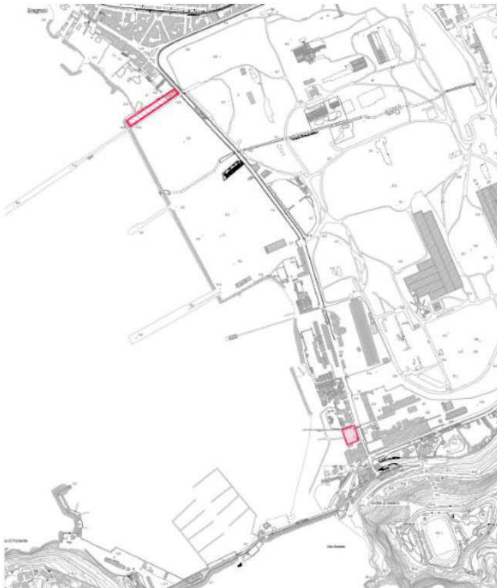
Inquadramento territoriale con individuazione aree parcheggi temporanei

Tale presidio sarà realizzato previo scotico superficiale per circa 20 cm e conseguente livellamento, al fine di evitare la differenza di quota che si creerebbe tra il piano carrabile del parcheggio di progetto e il piano viabile esistente di Coroglio che attualmente risultano complanari. Nello specifico il pacchetto sarà composto dai seguenti strati, a seguito di attività di regolarizzazione della superficie per dare le giuste pendenze funzionali al convogliamento delle acque alla canaletta di raccolta acque: