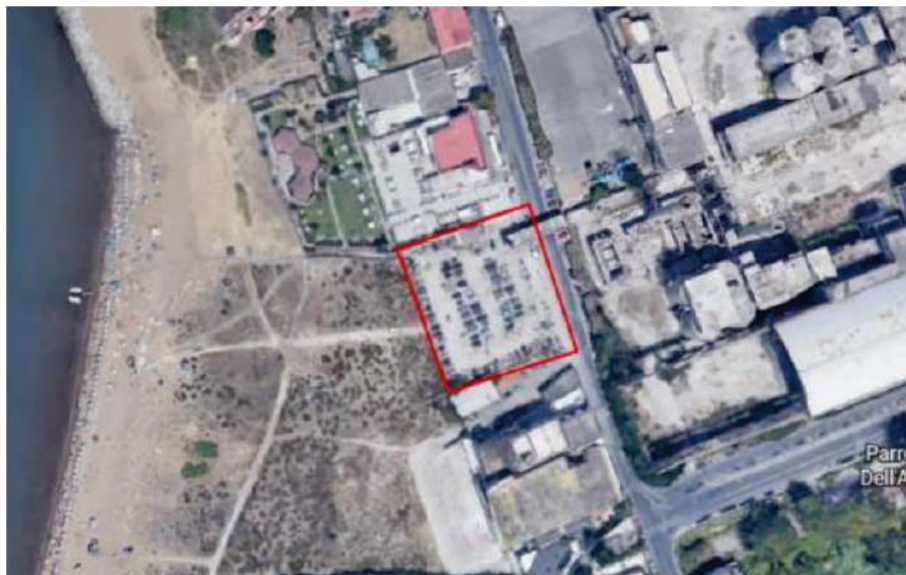
Figura 2 – Area parcheggio temporaneo Sbarcatoio Nisida.

Il progetto in essere prevede la realizzazione di un parcheggio temporaneo per 71 stalli.