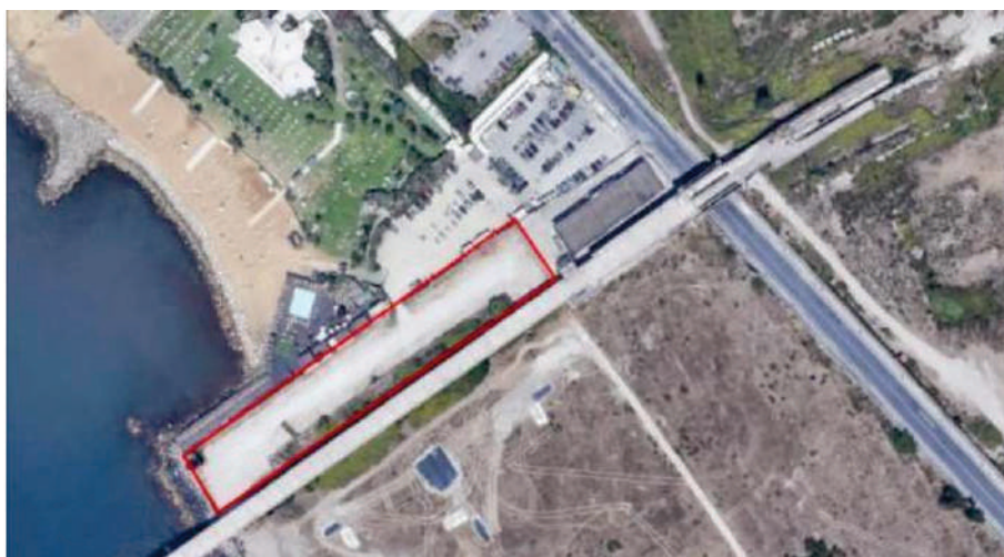
Figura 1 – Area parcheggio temporaneo Pontile nord.

Il progetto prevede la realizzazione di un parcheggio temporaneo per 104 stalli.