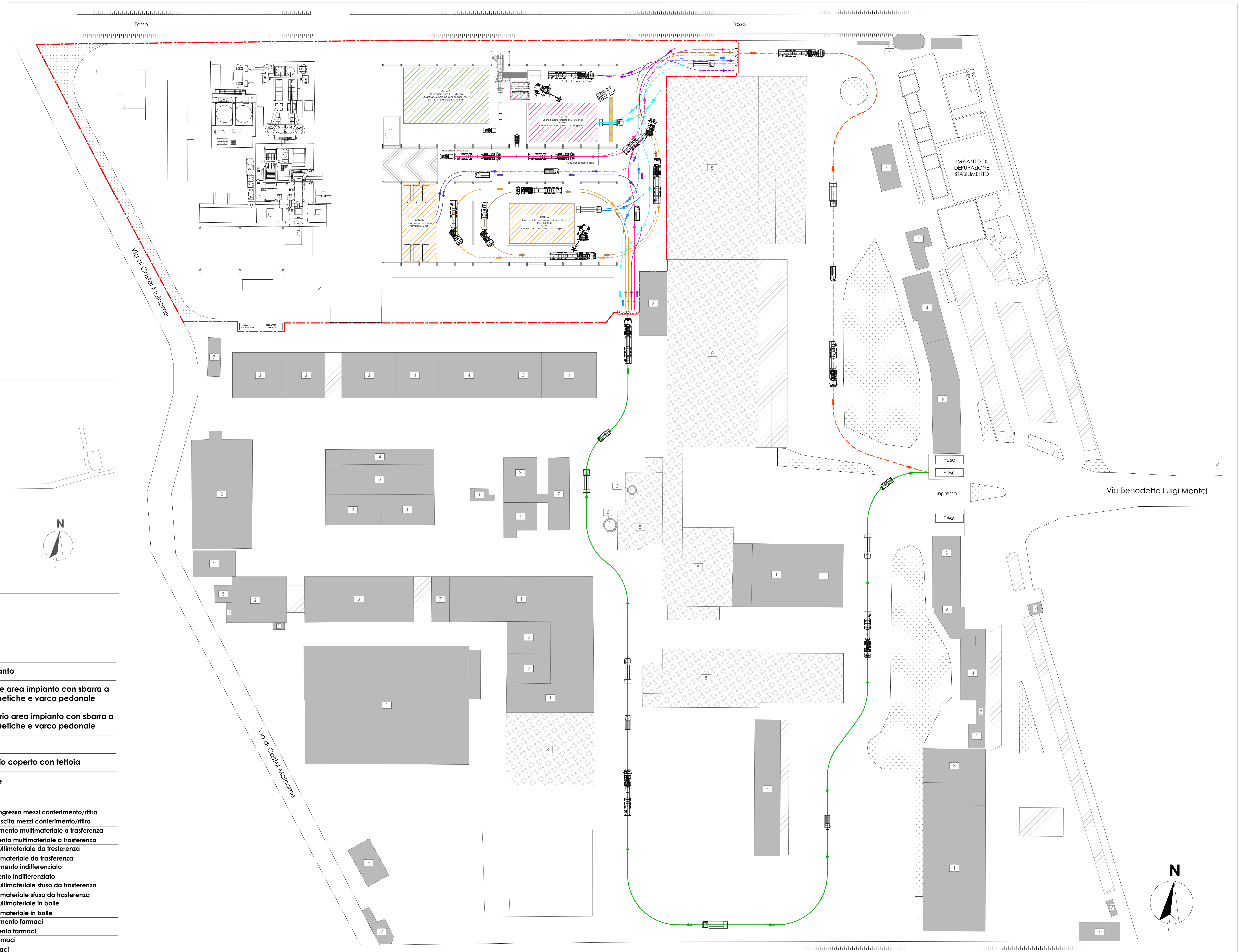
PLANIMETRIA VIABILITÀ INTERNA